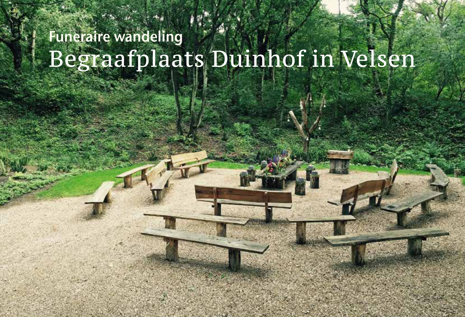
De buitenaula op Duinhof, geopend in 2015.